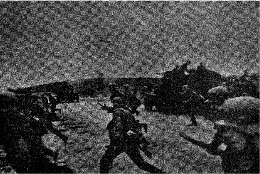
يك منظره از پیشروی واحدهای پیاده در پناه ارا به های جنگی و نیروی هوایی